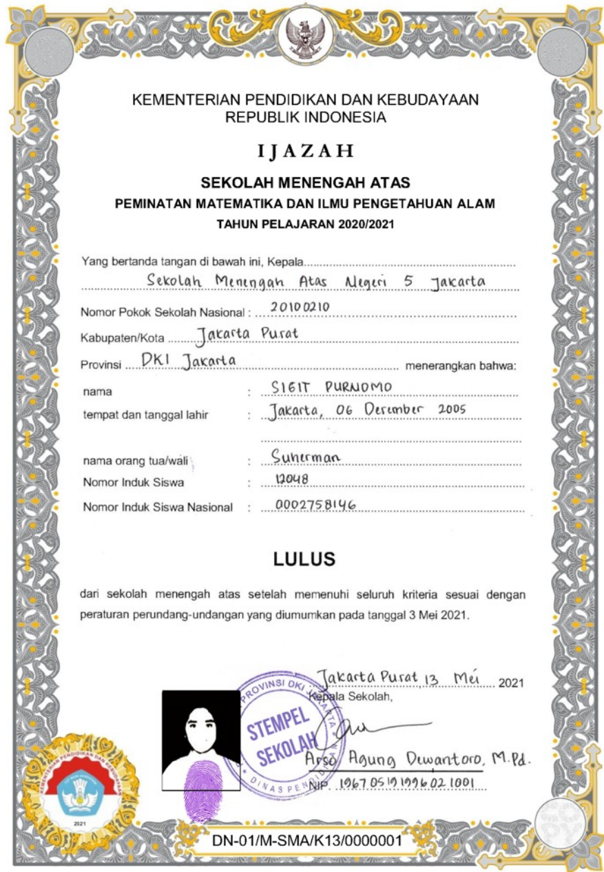
CONTOH PENULISAN IJAZAH HALAMAN DEPAN