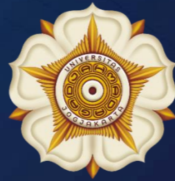
Universitas Gadjah Mada