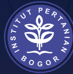
Institut Pertanian Bogor